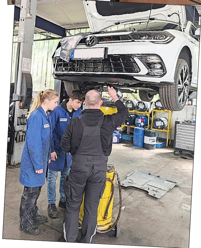
Symbolbilder, mit KI erweitert!